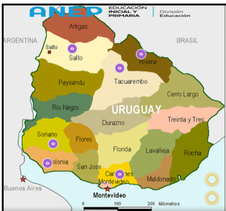
Imagen interactiva | Genially

Se sugiere dejar que los estudiantes exploren libremente los botones interactivos. Luego hacer hincapié en cómo nos conectan con las biografías de las mujeres que estaban en las imágenes de la actividad uno de la parte dos.