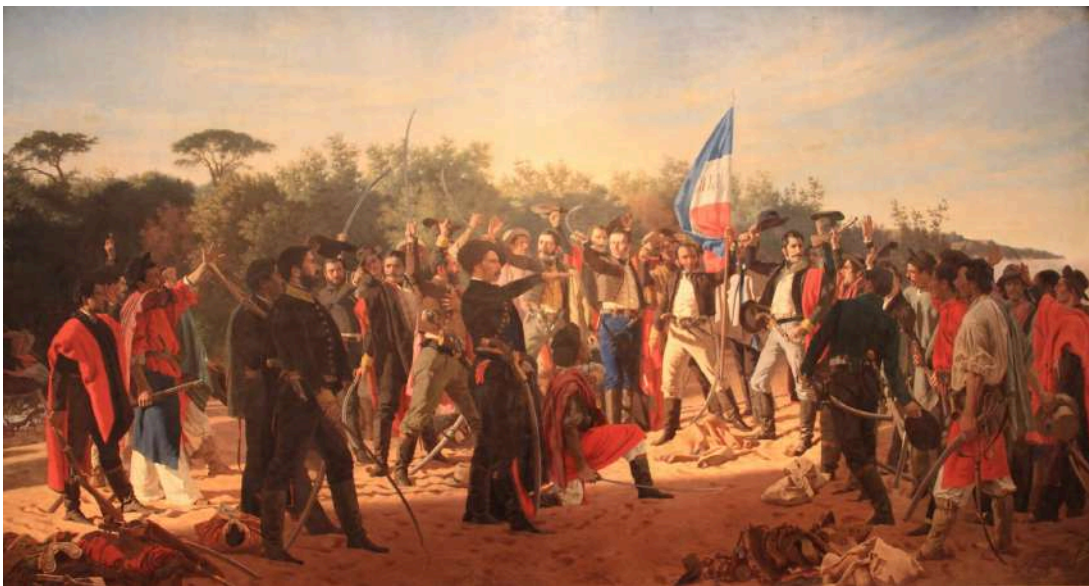
“Juramento de los Treinta y Tres Orientales” Juan Manuel Blanes (Creación entre 1875 y 1878)