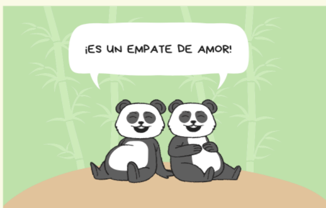
Imagen de plantilla de Canva