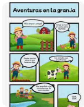
Canva Página 2 - Plantilla...