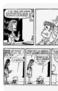
SIEMPRE 20 SIEMPRE 20: LA

Los niños tendrán que inferir qué palabra fue la que se escribió en el buscador para que aparecieran estas imágenes. Se puede reflexionar también sobre el por qué aparecen solo IMÁGENES.