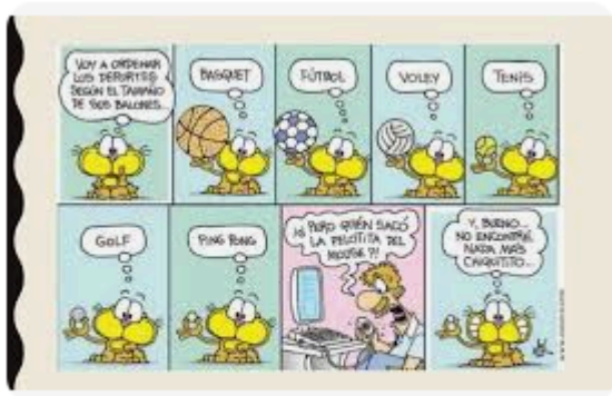
Slideshare La historieta es un tipo de narración se...