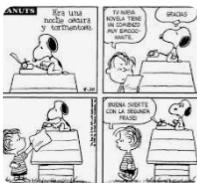
Pinterest 17 Ejemplos de Historietas...