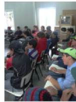
Escuela de Santa Ana (Treinta y Tres)

Objetivo: Sensibilización sobre Cooperación y Cooperativismo