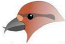
Comedor de semillas