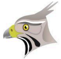
Ave de presa