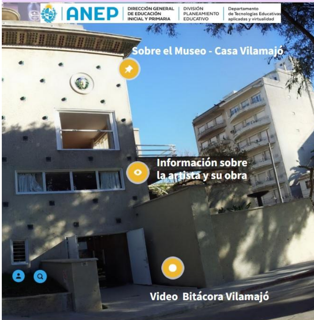
Imagen interactiva: “Museo Vilamajó”

Luego responde a las siguientes cuestiones :