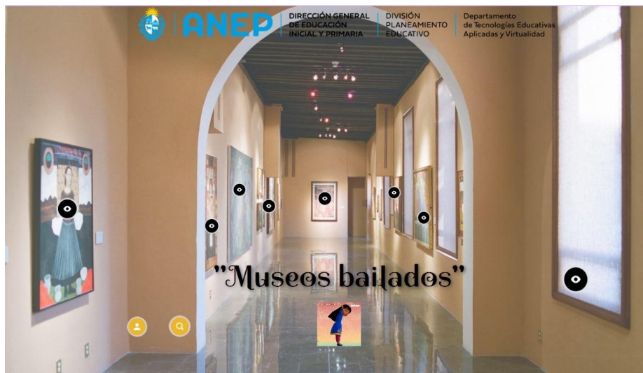
Imagen interactiva: "Museos bailados"