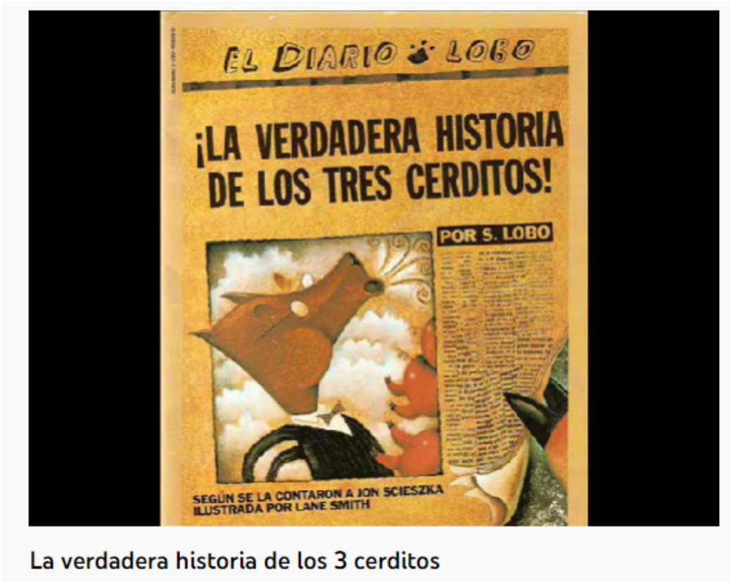
La verdadera historia de los 3 cerditos