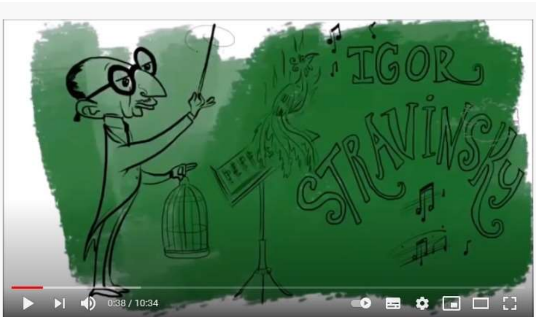
Igor Stravinsky - Grandes Compositores en su Tinta

Focalizar en la figura de Igor Stravinsky como uno de los músicos más importantes del 1900, destacar su figura como un gran compositor.