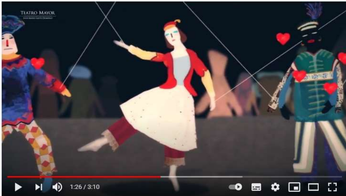
Petrushka, un mundo de plasticidad - Teatro Mayor

El inicio al tema puede ser mediante el visionado de la siguiente obra de marionetas Petrushka realizada de la compañía de títeres Per Poc .