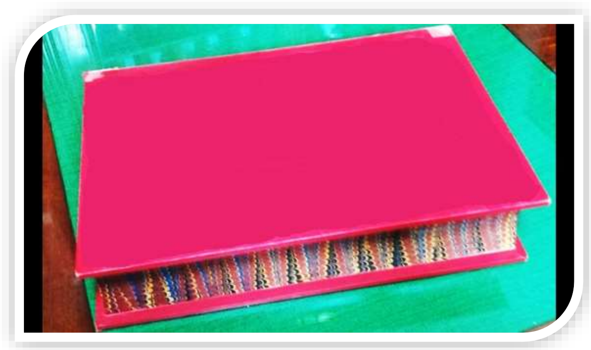
Imagen 1

En una pequeña ciudad hubo una vez un cuento vacío. Tenía un aspecto excelente, y una decoración impresionante, pero todas sus hojas estaban en blanco. Niños y mayores lo miraban con ilusión, pero al descubrir que no guardaba historia alguna, lo abandonaban en cualquier lugar.