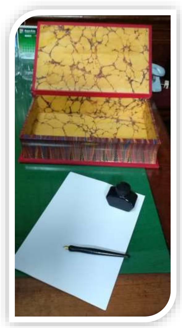
Imagen 4

preciosa historia de tres amigos que se ayudaban para mejorar sus vidas.