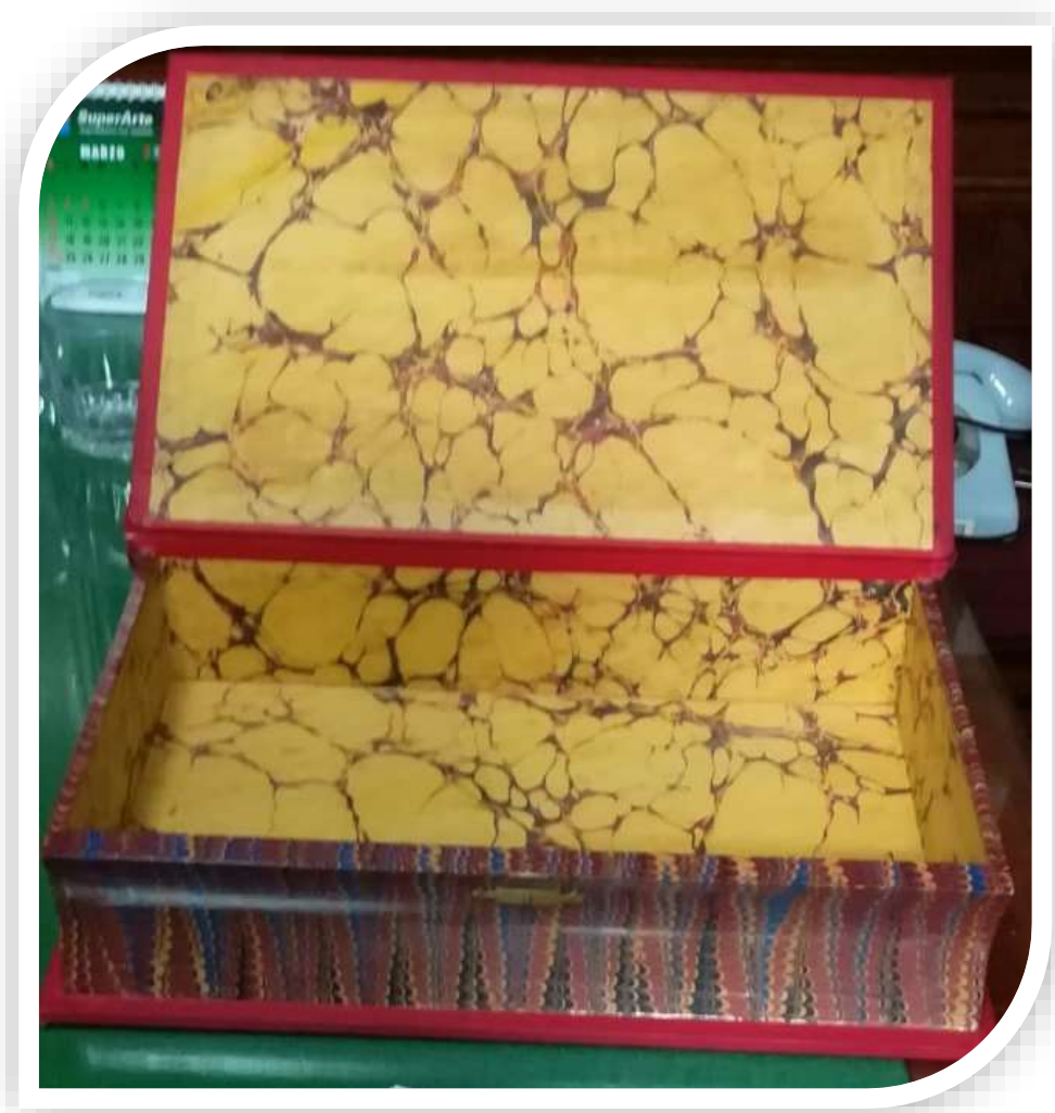
Imagen 2 aportada directamente por el Museo Pedagógico José Pedro Varela , con autorización del propietario para utilizarse en este recurso.

No muy lejos de allí, un precioso tintero seguía lleno de tinta desde que hacía ya años su dueño lo dejara olvidado en una esquina. Tintero y cuento lamentaban su mala suerte, y en eso gastaban sus días.