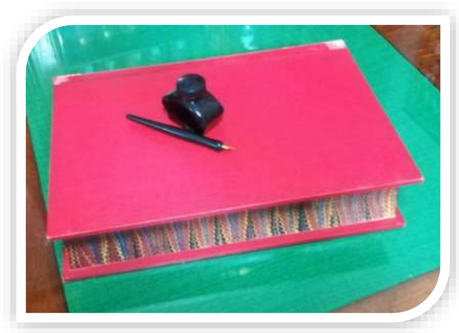
Imagen 5 aportada directamente por el Museo Pedagógico José Pedro Varela , con autorización del propietario para utilizarse en este recurso.