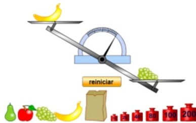
Figura 1. Imagen portada simulador Equilibra la balanza. Educaplus

Determina con tu grupo la masa de diferentes frutas utilizando un simulador de una balanza de brazos iguales. Para acceder al simulador debes ingresar a: